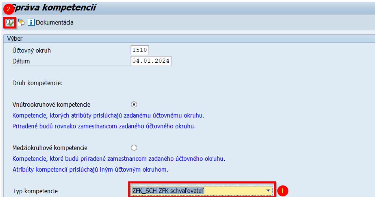
Obrázok 1 Transakcia ZWFRY_KOMPETENCIE

Detailný popis kompetencie a pravidiel na vyplňovanie atribútov je možné zobrazíť priamo v systéme v transakcii ZWFRY_KOMPETENCIE.