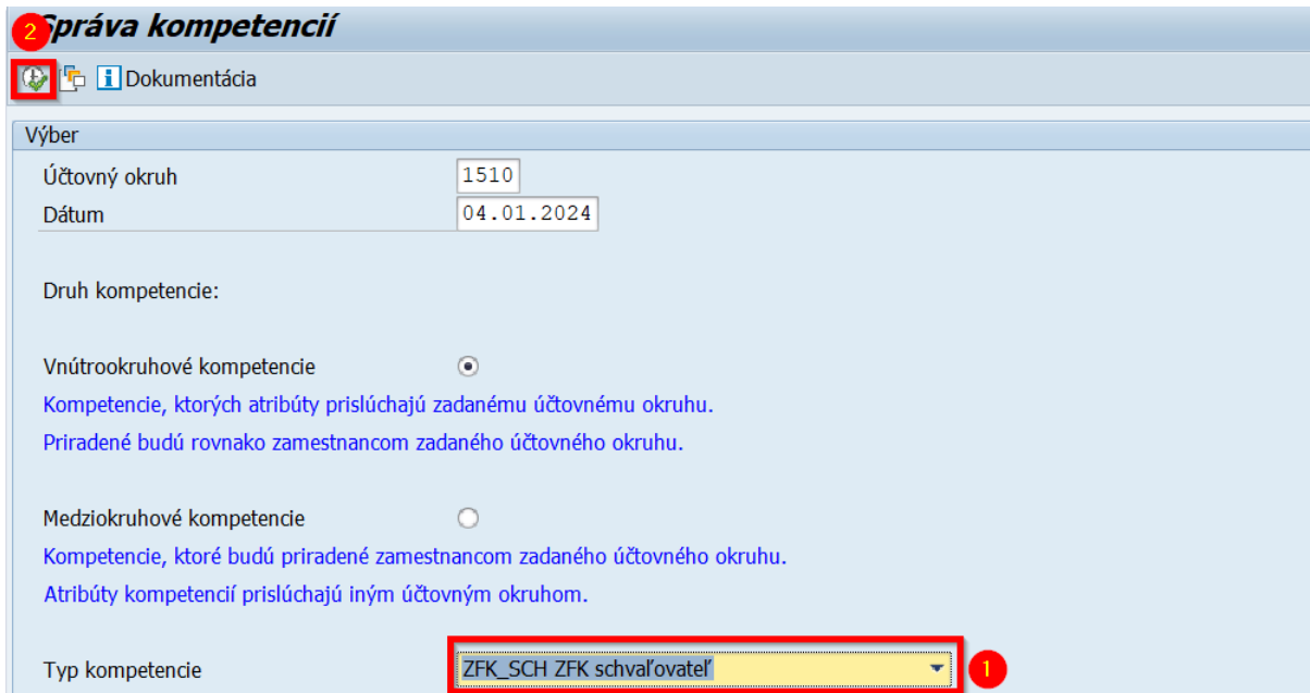
Obrázok 1 Transakcia ZWFRY_KOMPETENCIE

Detailný popis kompetencie a pravidiel na vyplňovanie atribútov je možné zobrazíť priamo v systéme v transakcii ZWFRY_KOMPETENCIE.