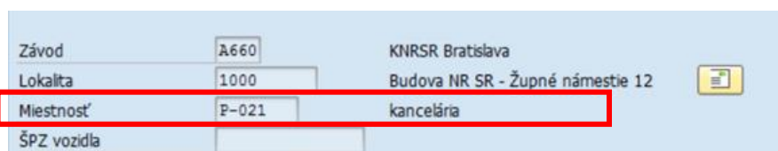
Obrázok 1 Pole „Miestnosť“ na karte majetku v module FI-AA

Východiskový údaj pre prepojenie konkrétnej miestnosti medzi modulmi FI-AA a RE-FX je údaj z číselníka Miestnosť v module FI-AA , nakoľko je napojený na ďalšie objekty v CES. Pole „Krátke označenie“ v module RE-FX je textové pole. Na to aby mohli byť údaje medzi modulmi prepojené, tak je potrebné aby hodnota z číselníka miestností v module FI-AA evidovaná na karte majetku ako Miestnosť, bola v rovnakom formáte (medzery, pomlčky) ako údaj v poli „Krátke označenie“ v AO miestnosť modulu RE-FX. Obrázok 1 je ilustračný. Zobrazuje pole Miestnosť na karte majetku.